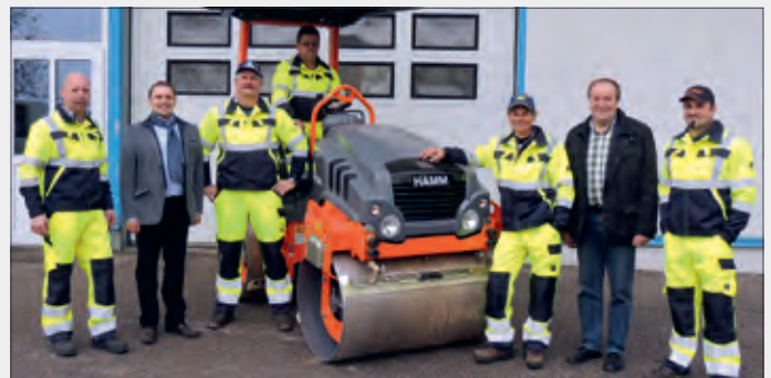
Mitarbeiter des Bauhofes mit der neuen Hamm Straßenwalze

Besonders erfreulich ist, dass eine weitere, verkehrssichere Gehwegverbindung von der Römerstraße bis zur Andersdorfer Straße hergestellt wurde. Hier findet eine Kostenteilung zwischen Gemeinde und der Straßenmeisterei Lavamünd, die den Unterbau errichtete statt, sodass für die Gemeinde nur der Aufwand für die Asphaltierung in der Höhe von ca. € 25.000,- verbleibt.