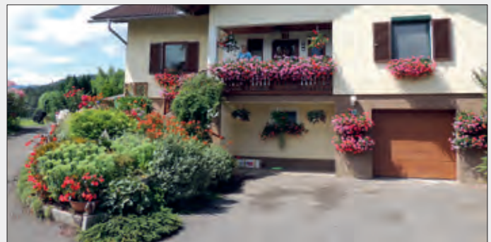
1. Platz Bauernhof: Herlinde Kaimbacher

Ein Dankeschön an alle Teilnehmerinnen und an alle Blumenfreunde für die wunderschöne Bepflanzung von Gebäuden und Gärten in unserer Gemeinde.