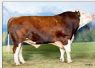
Sieger-Zuchtstier IGEL, ca. 1250kg Halter Fam. Ortolf, vlg. Lackner