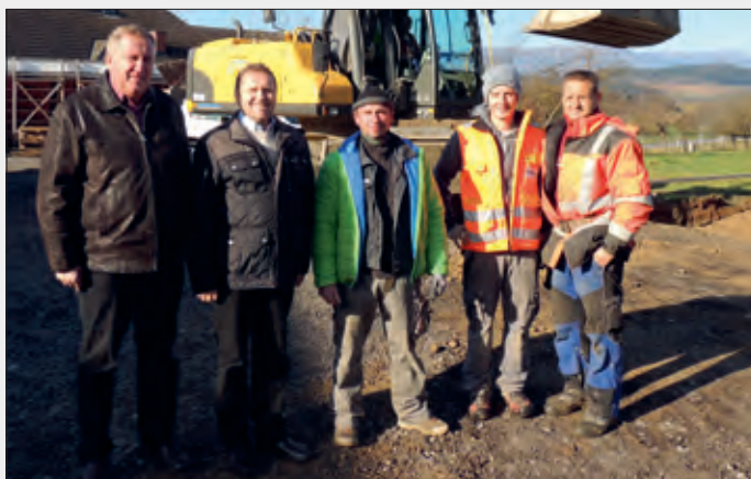
Betriebsansiedlung in Matschenbloch Firma Pansy-Dach GmbH Baubeginn der neuen Betriebshalle

Die Bevölkerungszunahme beträgt ca. 2 %, aktuell sind 2231 Personen in der Gemeinde gemeldet, wovon 2026 Haupt- und 205 Nebenwohnsitze zu verzeichnen sind. Davon 1124 weibliche und 1107 männliche Personen. Die Geburtenstatistik 2016 ist glücklicherweise positiv, es sind mehr Geburten als Sterbefälle zu verzeichnen.