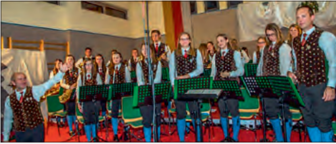
Trachtenkapelle St. Georgen

Rund 300 Besucher wurden bei den beiden diesjährigen Herbstkonzerten der Trachtenkapelle St. Georgen im Turnsaal der VS St. Georgen auf hohem musikalischen Niveau bestens unterhalten – instrumental und auch vocal. Nach der erfolgreichen Eingliederung des Jugendorchesters „TK Juniors“ besteht der Klangkörper nunmehr aus 40 Mitgliedern und zählt mit einem Durchschnittsalter von zwanzig Jahren zu den jüngsten Musikkapellen im Land.