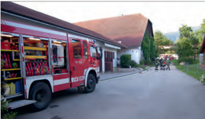
FF Abschnitts-Einsatzübung beim Fernwärmeheizwerk vlg. Roscher in St. Georgen

Ein herzliches Willkommen unseren neuen Erdenbürgern!