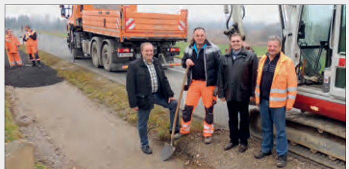
Verkehrssichere Gehwegverbindung Römerstraße bis Andersdorfer Straße

• für das ländliche Wegenetz mit Abschluss der Asphaltierung bei der Rinner Straße und die Unterbau- und Entwässerungsmaßnahmen an der Steinberg Oberhauser