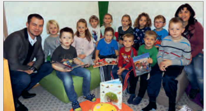
Neue Möbel für den Kindergarten

seit Sommer erfolgreich in Betrieb und zur Gänze ausgelastet. Es ist besonders erfreulich, dass wir in unserer Gemeinde alle Kinder vom 1. bis zum 14. Lebensjahr ganztägig beaufsichtigen und betreuen können.