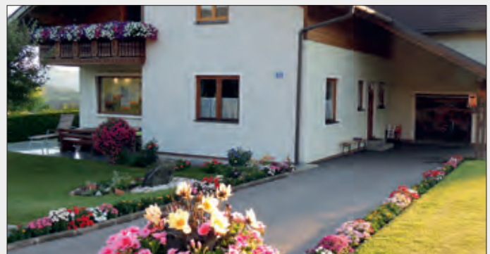
1. Platz Privathäuser: Renate Guntschnig