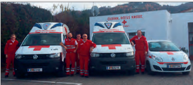
Das Team heute

Am 1. Oktober 1996 nahm ein Sanitätskraftwagen am Stützpunkt „Lavanttal Süd“ seinen Dienst auf. Fünf Jahre später glänzte der Zubau für die vielen